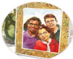
Family & Friends