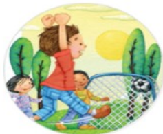
Sports & Outdoors