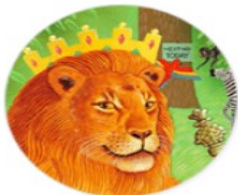
Animals & Plants